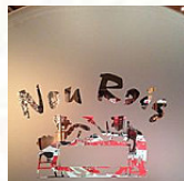
Cal Mosset main image