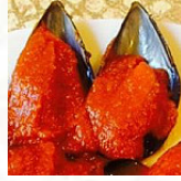
Mejillonera main image