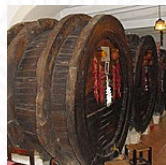
Can Lau main image