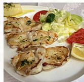
La Cepa main image