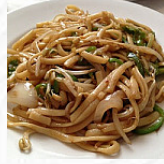
...g main image